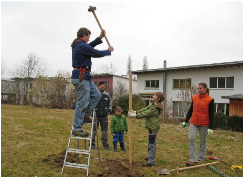
Februar 2011: Obstbaumpflanzung im Waldhof