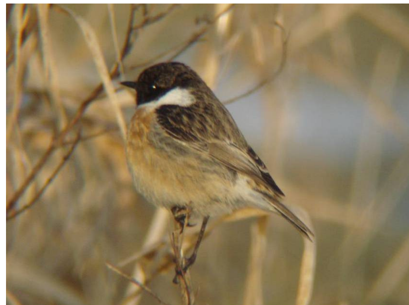
Premiere 2011: 1. Brut eines Schwarzkehlchens in Suhr!